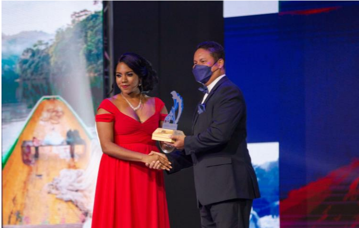
1er. Premio Escultura Verónica Espinoza