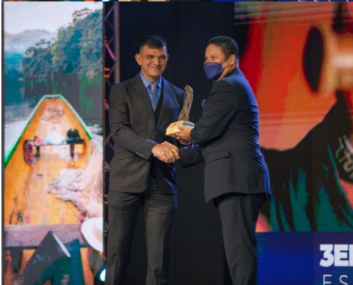
3er. Premio Escultura Ariel Aníbal Jurado