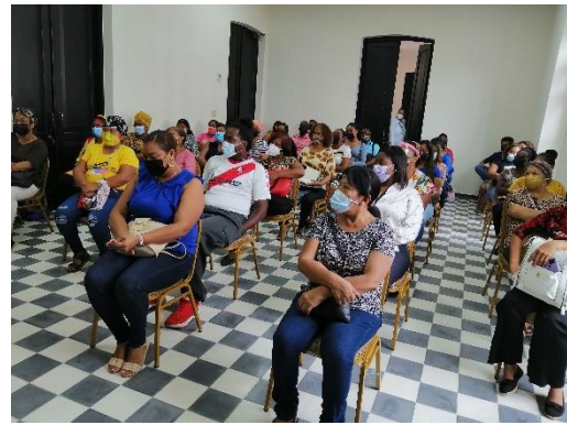
Provincia de Colón