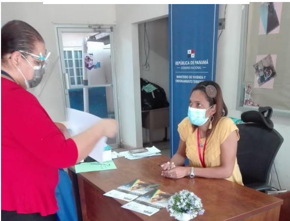
Provincia de Herrera