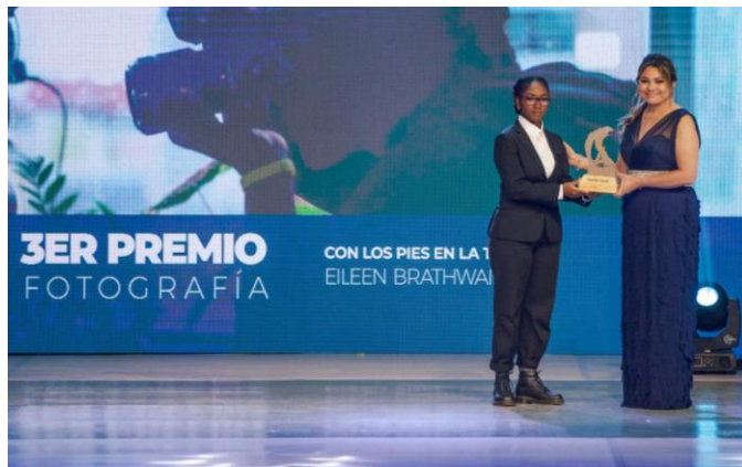
3er. Premio Eileen Brathwaite