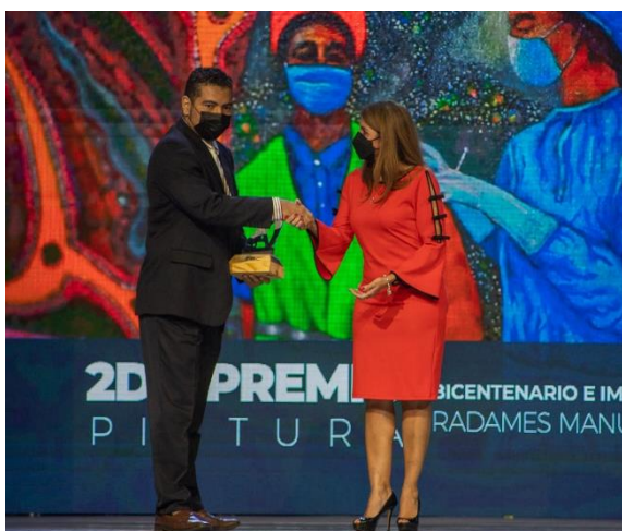
2do. Premio Radames Pinzón