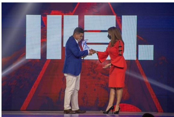
1er. Premio Damian Rivas