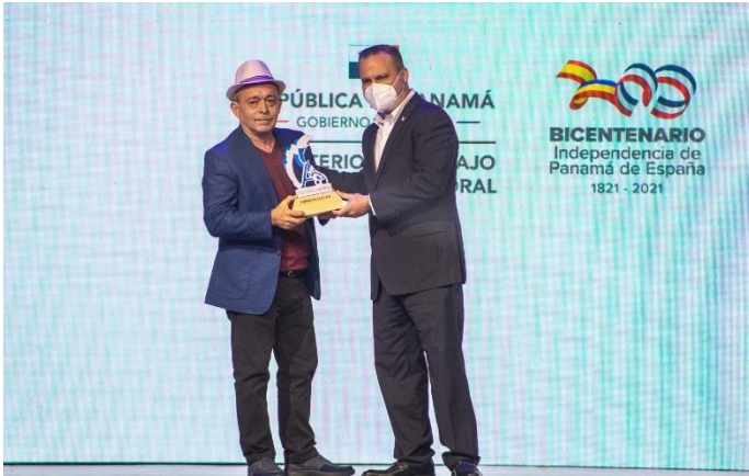
1er. Premio Jorge Luis Camaño