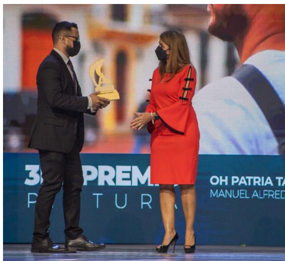
3er. Premio Manuel Serrano