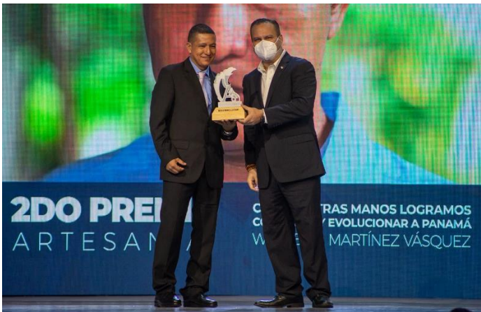
2do. Premio Wilfredo Martínez