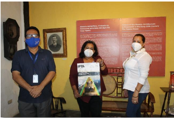
Provincia de Coclé