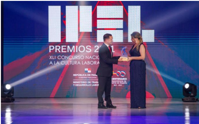
1er. Premio Samuel Saucedo