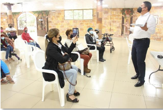
Provincia de Chiriquí