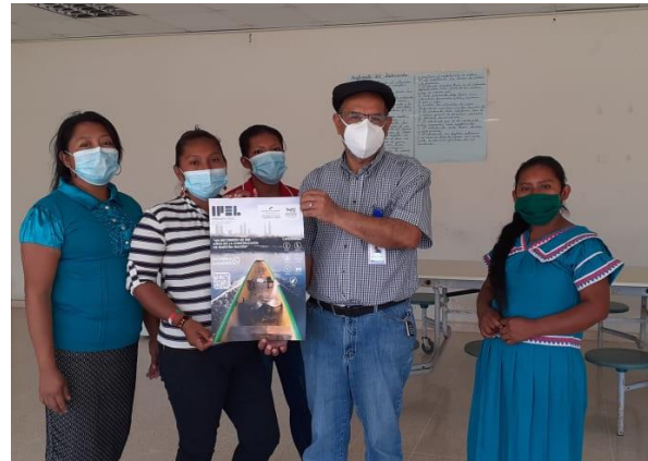
Comarca Ngäbe Bugle