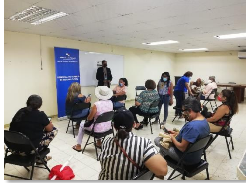
Provincia de Panamá Oeste