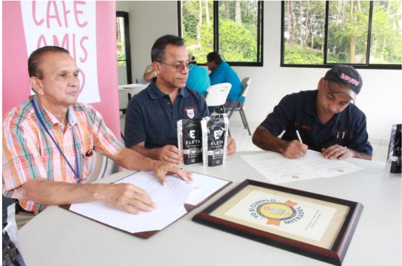
MITRADEL reconoce con el sello «Yo Si cumpla» a Finca Café Eleta por buenas prácticas laborales